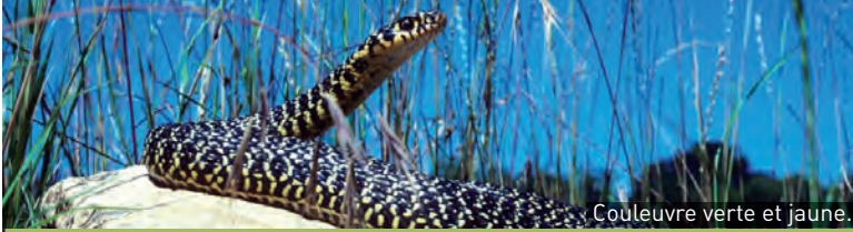
Couleuvre verte et jaune.